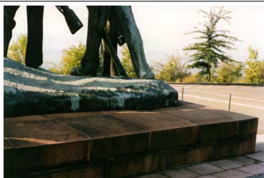
vor der Instandsetzung

Die Wiedereinweihung konnte unter großer Anteilnahme der Bevölkerung am 09.09. 2005 gefeiert werden.