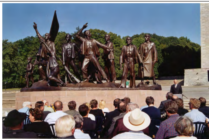
Wiedereinweihung des Mahnmals