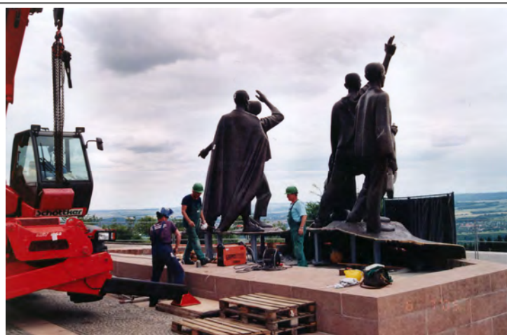
Aufbau der Figurengruppe

mit Kontaktplatte / fertige Fußkonstruktion