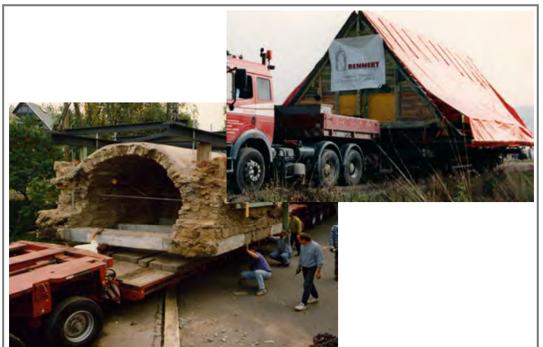
Verladen und Umsetzen von Keller und Dach