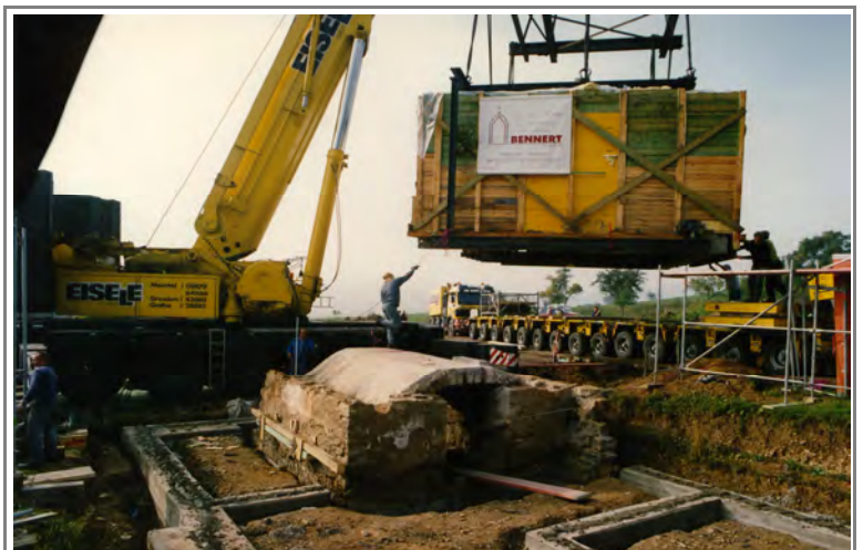
Aufsetzen des Erdgeschosses am neuen Standort