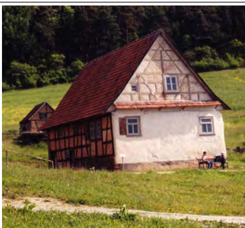
in Hohenfelden nach Sanierung und Umsetzung