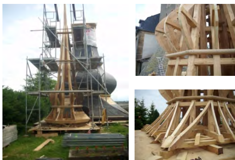
Neuaufbau der Turmhaube

Grundriss : ca. 6,90m x 6,90m Gesamthöhe: ca. 17,5 m Turmhaube Gewicht: 15,7 + 1,8 = 17,5t