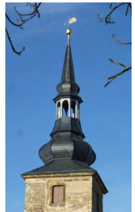
Schnitt / Visualisierung / neue Turmhaube