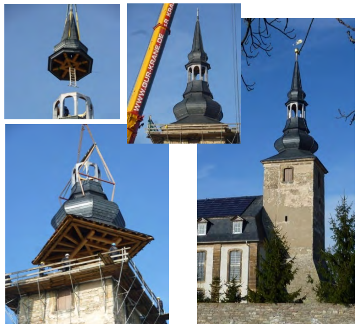
Aufsetzen der neuen Turmhaube am 01.02.2011