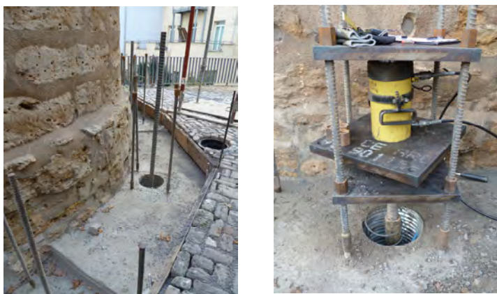
Bauarbeiten zur Gründungssanierung