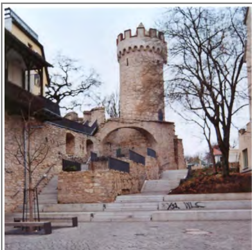
Ansicht nach Sanierung