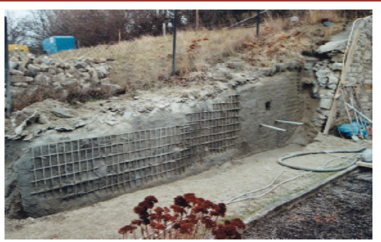
Neubau Stützwand Wandverbreiterung mit Beton

Allgemeines/Bauwerksdaten: Sanierung der zu erhaltenden Hauptstützwand auf der Westseite wurde mit selbsttragenden Erdvernagelungs - Elementen GEWI-Dauerbodennägel gem. Zulassung mit Einpressmörtel DIN 18309 sowie Lastverteilungselementen DIN 1045-2 (unbewehrte Kreisfundamente) ausgeführt. Die seitliche Flügelwand auf der Nordseite mußte auf Grund ihres schlechten Bauzustandes neu aufgebaut werden.