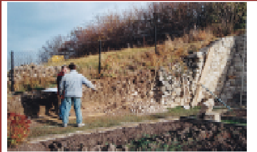
Abbruch der völlig maroden Natursteinstützwand der Nordseite