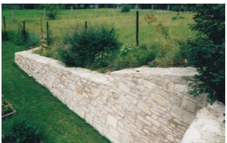
fertige neue Stützwand (Nordseite) aus Naturstein