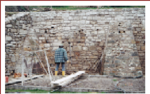
Sanierung Stützwand mit Pfeilern